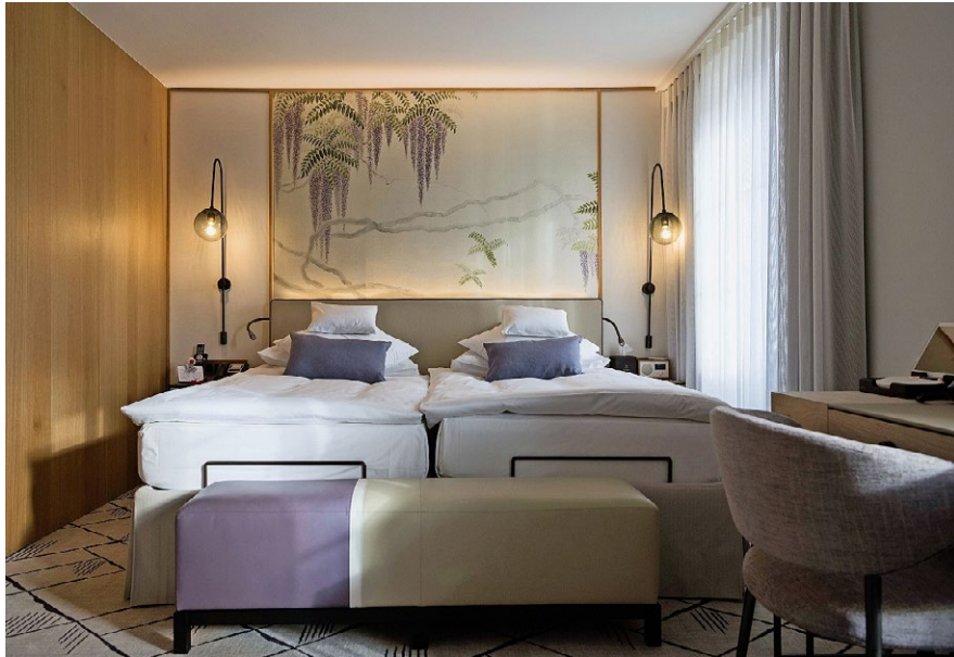
Die Zimmer im Storchen sind nun heller, das Mobiliar ist leichter.

Das geschichtsträchtige Haus war ab dem 3. Januar bis auf eine Ausnahme