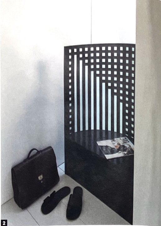
1. Vue sur la façade arrière de la maison. Sur un plateau rehaussé, l'architecte a aménagé un petit jardin ensoleillé. Juste assez grand pour accueillir deux chaises longues, conçues par le designer Richard Schultz pour Knoll dans les années 1960. 2. Le siège '312 Willow 1', créé par l'architecte et designer Charles Rennie Mackintosh pour Cassina, est une sculpture en soi. 3. Le jardin est également accessible à partir de l'espace de vie du premier étage, grâce à l'escalier extérieur. 4. La salle de bains du deuxième étage, vue de la chambre des parents.