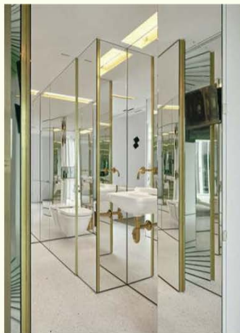
Links: 'Place m'as-tu-vu': de toiletruimte werd een spectaculaire spiegelkamer, toch krijgt deze plek binnenkort een andere invulling en wordt het een intieme inloopbar.

Doken als duo op in tv-programma's als Mijn Pop-Up Restaurant en De Boxy's (Vier) . boxys.be