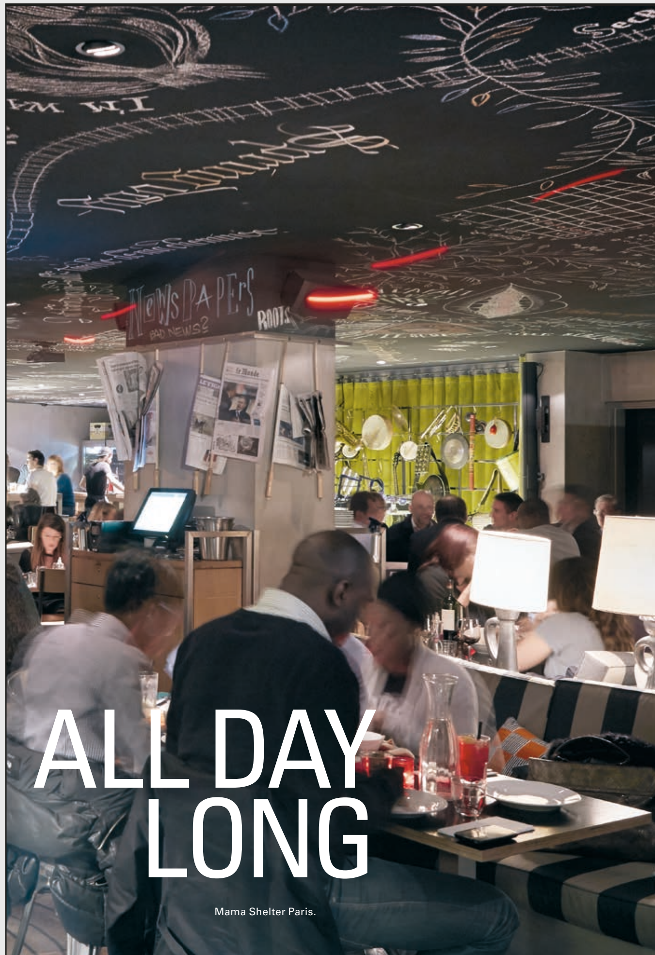
Mama Shelter Paris.