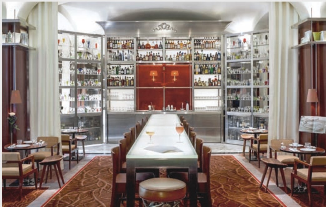
Im «Royal Monceau Paris», einem Luxushotel des Raffles Brand, gibt es ein sehr elegantes Gastronomiekonzept mit Bar, Restaurant, Café und Lounge: Die Bar selber ist zum Zuklappen.

→ wie ein Bienenstock brummt! Die Innenarchitektur ist dabei der Schlüssel zu einem Konzept, das eine so vielfältige Nutzung von frühmorgens bis spätabends hindurch ermöglicht und visuell überzeugend ist. Zum besseren Verständnis nenne ich einige typische Beispiele: Ein technisch raffiniertes und erstklassiges Möbelstück, das morgens als Frühstücksbuffet mit Kälteteil gut aussieht und sich dann in eine elegante oder fancy Bar-Theke verwandelt. Vielleicht auch eine Bar-Theke mit komfortablen Bar-Hockern, an der Frontcooking zelebriert werden kann. Ein Bar-Rückmöbel, das morgens mit Vorhang oder Schiebewand verdeckt wird, damit kein Alkohol sichtbar ist.