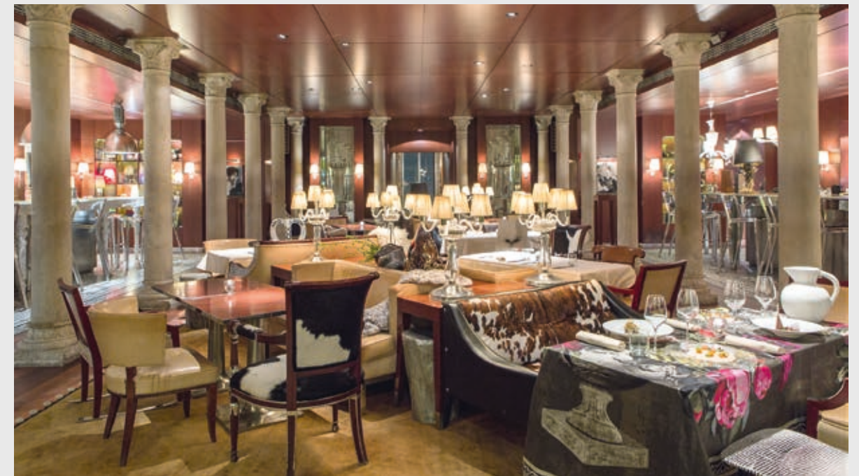
Das kleine Fünfsterne-Superior-Hotel Palazzina Grassi in Venedig ist ein Paradebeispiel dafür, wie ein Frühstücksraum multifunktional genutzt werden kann.

Reinigung · Unterhalt · Ausstattung · Bauliche Massnahmen